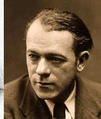
Collège Raoul Dufy